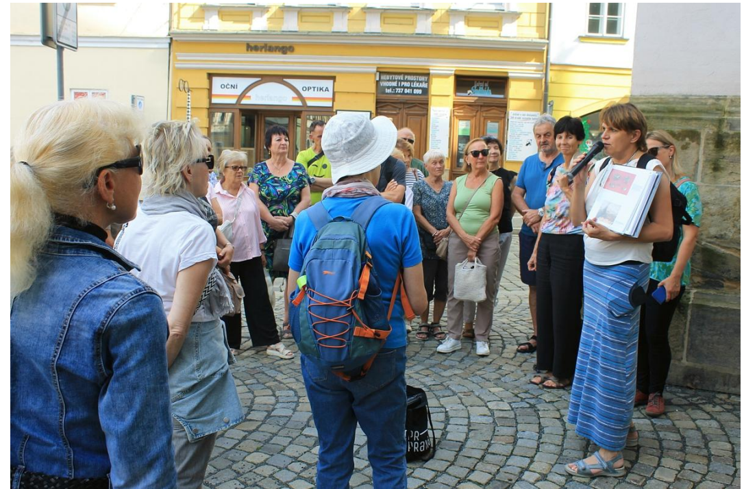
Dny evropského dědictví - 11. a 12. září 2025 Olomouc archeologická – Top Ten