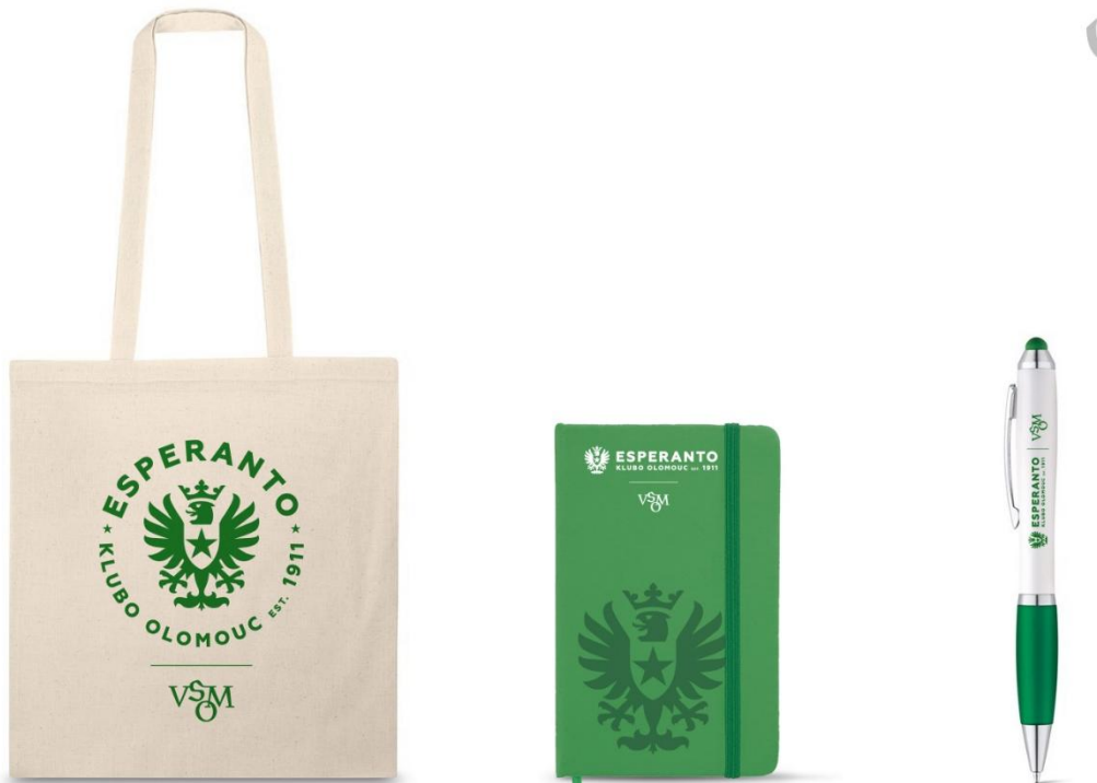
Sekce Esperanto – Světový sjezd esperantistů – srpen 2025