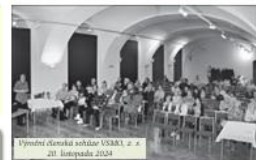
Muzejní středí - přednášky

Letošní podzimní program VSMO podporuje Statutární město Olomouc.